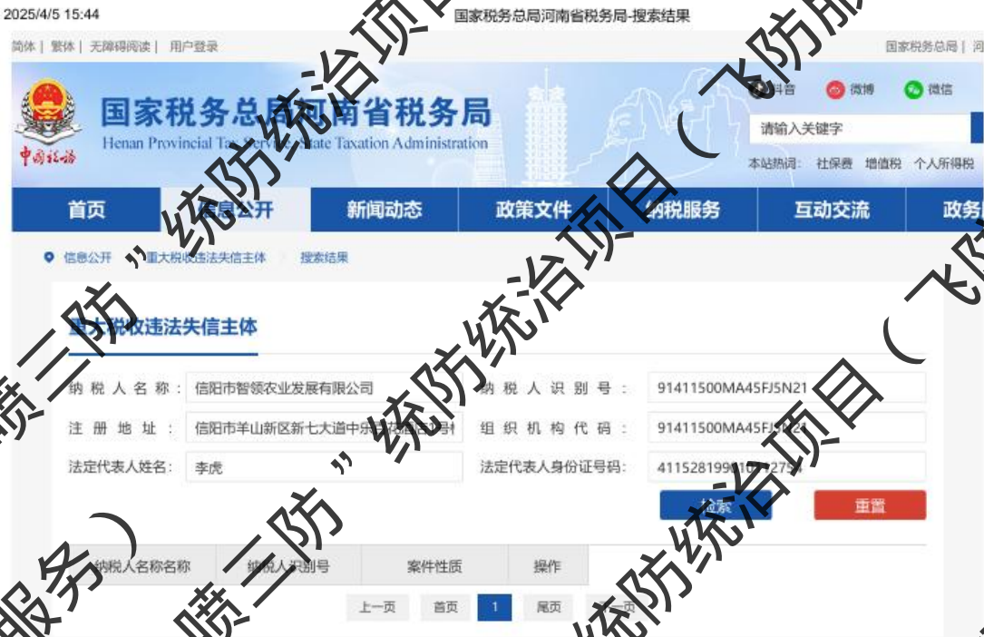
国家税务总局网站截图